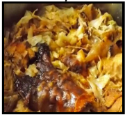
Kuvan kupus sa slavskim pečenjem